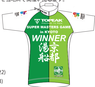
シリーズチャンピオンジャージ(イメージ)